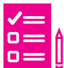
Gestion de projet