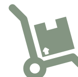
Gestion des déménagements