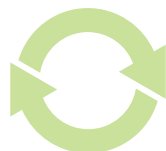
Remise à neuf