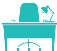
Services de CAO